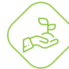
RISPETTO PER L'AMBIENTE