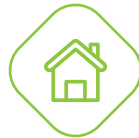
DISINFEZIONE INTERNA ED ESTERNA