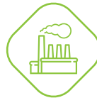
DISINFEZIONE URBANA E INDUSTRIALE